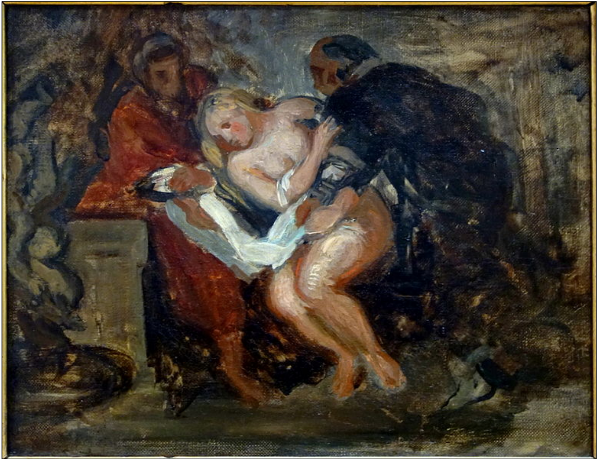
Eugène Delacroix, Suzanne et les vieillards , vers 1850 https://fr.wikipedia.org/wiki/Fichier:Lille_PdBA_delacroix_suzanne_vieillards.JPG