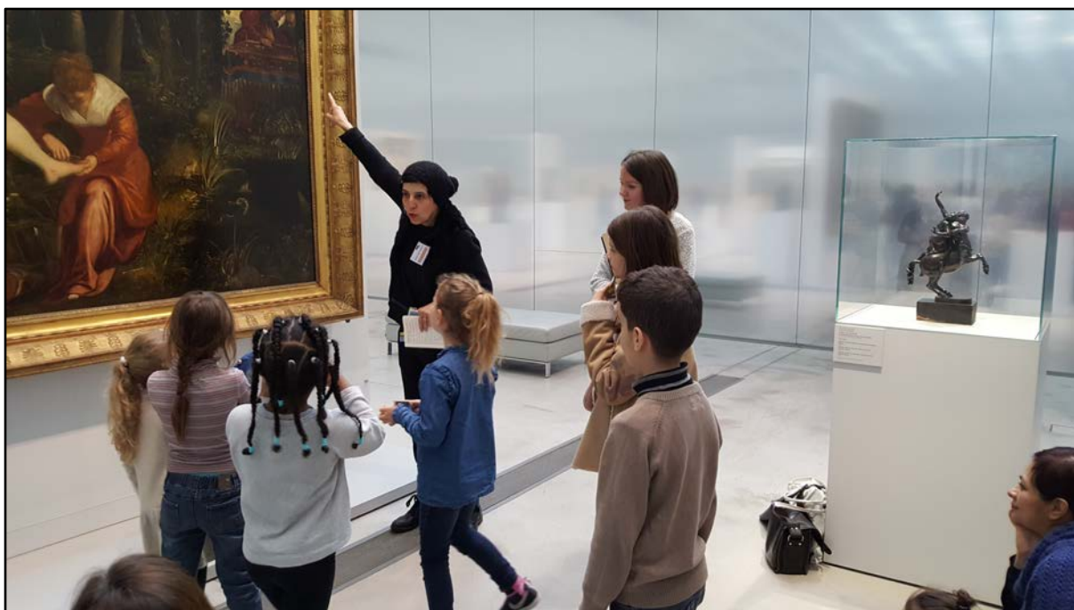
Visite à deux voix au musée du Louvre Lens