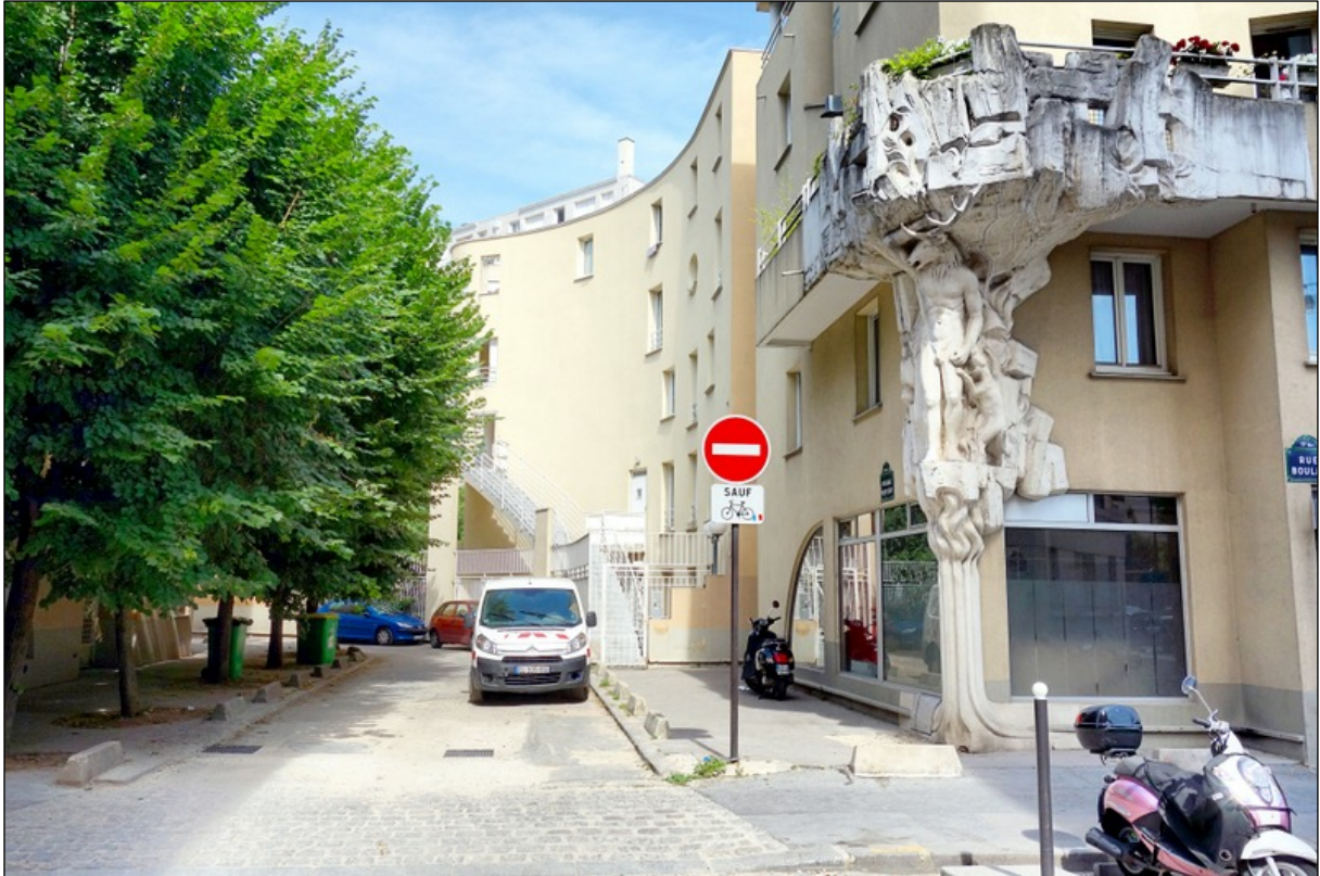
Cariatides de Philippe Rebuffet, « Actéon changé en cerf par Diane chasseresse », Passage du Petit-Cerf, Paris, 17 e arrondissement https://www.parisladouce.com/2018/03/paris-cariatides-de-philippe-rebuffet.html