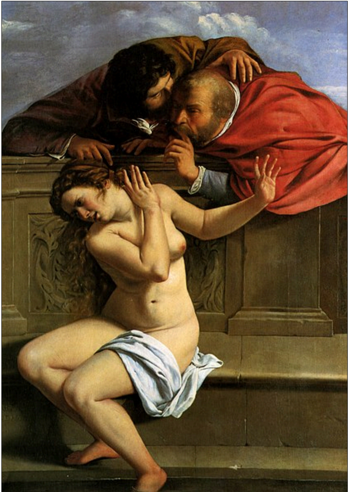
Artemisia Gentileschi, Suzanne et les vieillards , vers 1610

https://fr.wikipedia.org/wiki/Fichier:Susanna_and_the_Elders_(1610),_Artemisia_Gentileschi.jpg