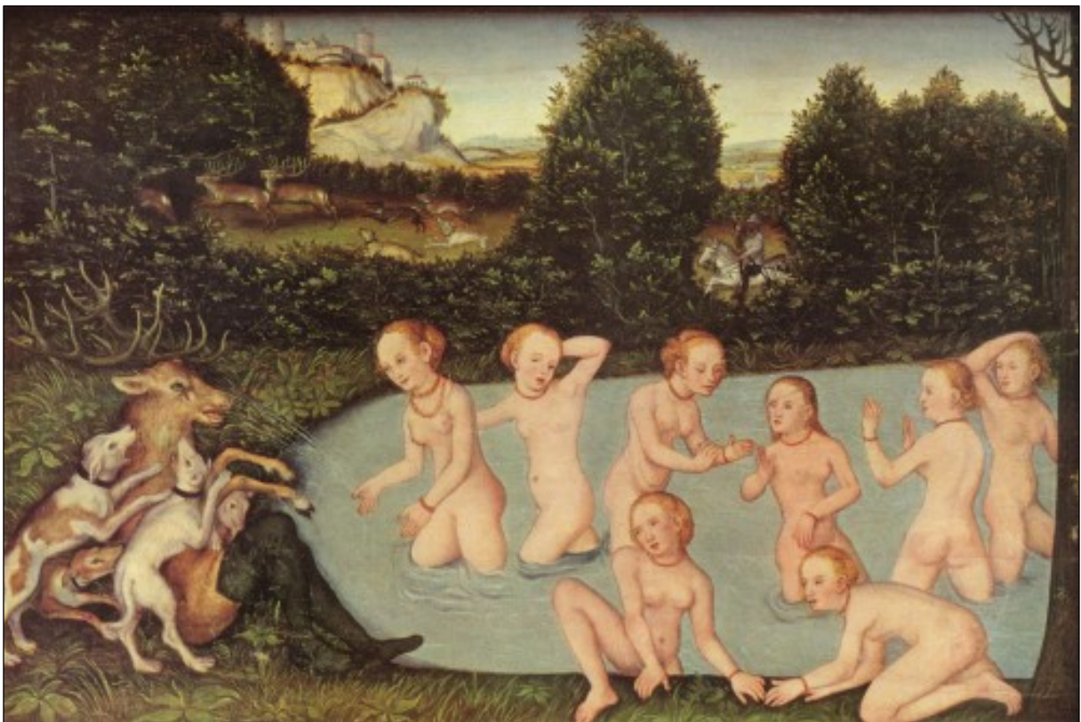
Lucas Cranach l'Ancien, Diane et Actéon , 16 e siècle