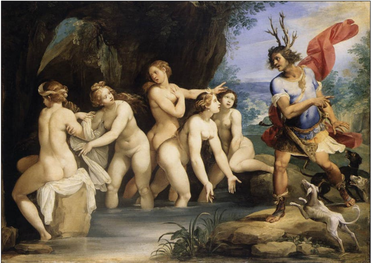
Cesari Giuseppe, dit le Cavalier d'Arpin (1568-1640), Diane et Actéon, Musée du Louvre