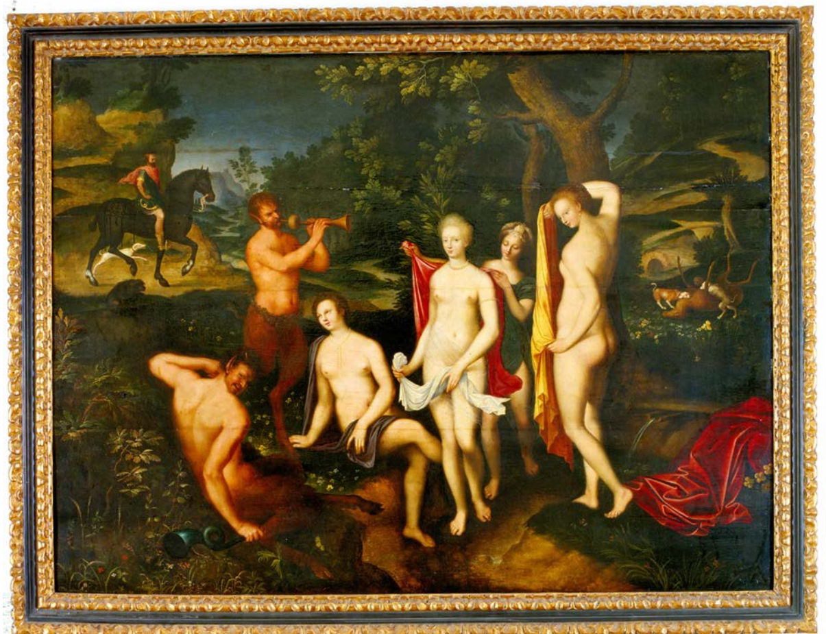
Exposé au musée des Beaux-Arts de Tours