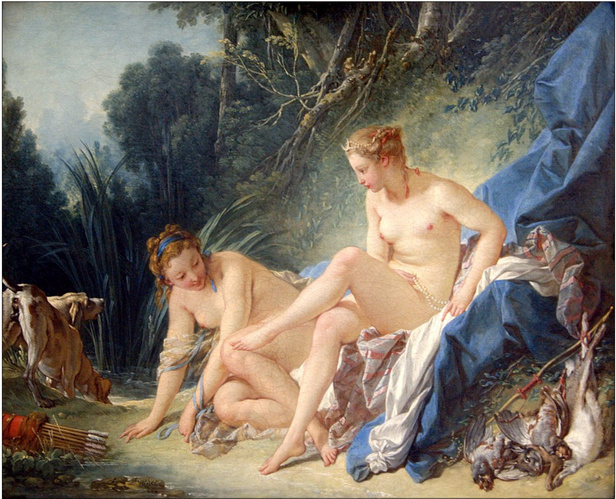
François Boucher, Diane sortant du bain , 1742, Musée du Louvre https://fr.m.wikipedia.org/wiki/Fichier:Boucher_Diane_sortant_du_bain_Louvre_2712.jpg