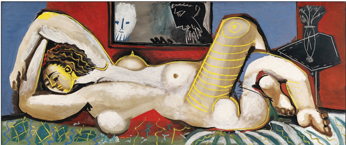
Pablo Picasso, Susana y los ancianos , 1955 https://exit-express.com/wordpress/wp-content/uploads/2017/01/susana_y_los_ancianos_web.jpg