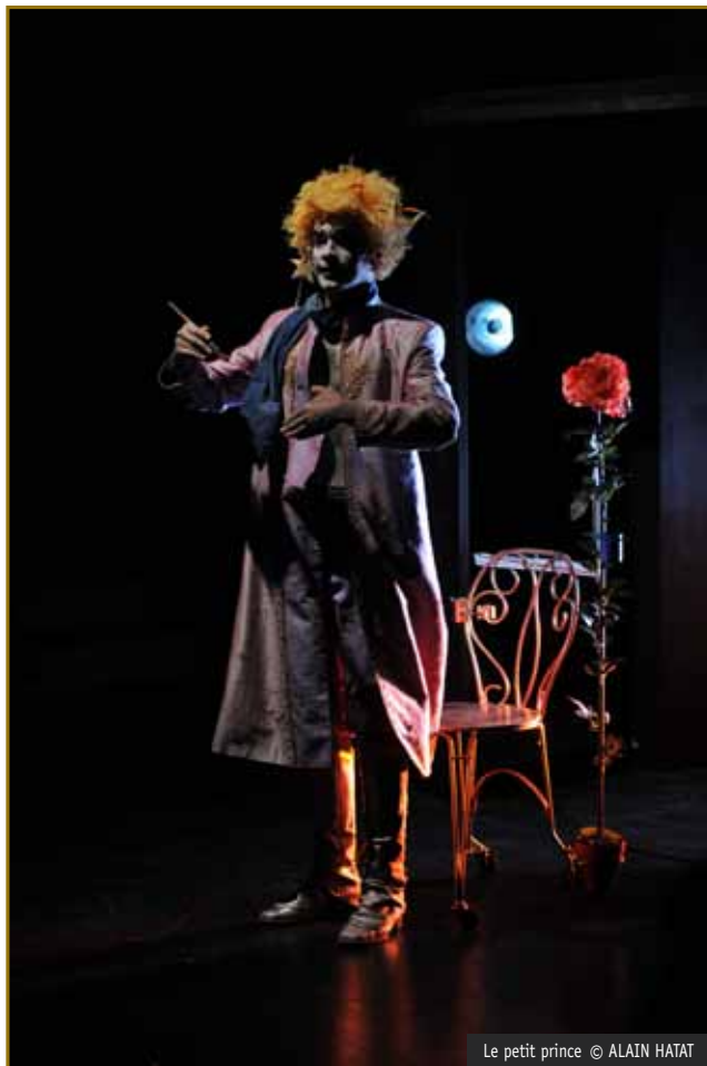
Le petit prince