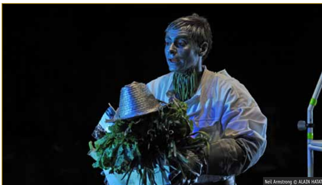
Neil Armstrong

→ Lire les couleurs : quelles couleurs dominent chez ce personnage ? À qui ou à quoi te fait penser ce personnage avec son visage et ses cheveux argentés ? Quel est le matériau utilisé pour son chapeau ? Effectue des recherches sur Neil Armstrong et essaie d'expliquer le choix de ces couleurs, de ces matériaux.