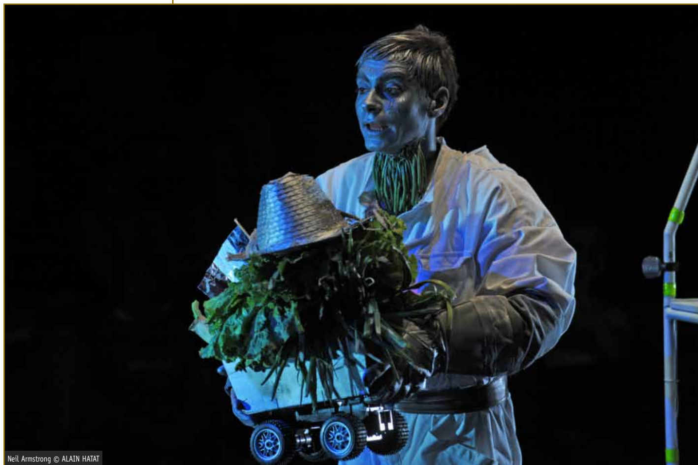
Neil Armstrong © ALAIN HATAT