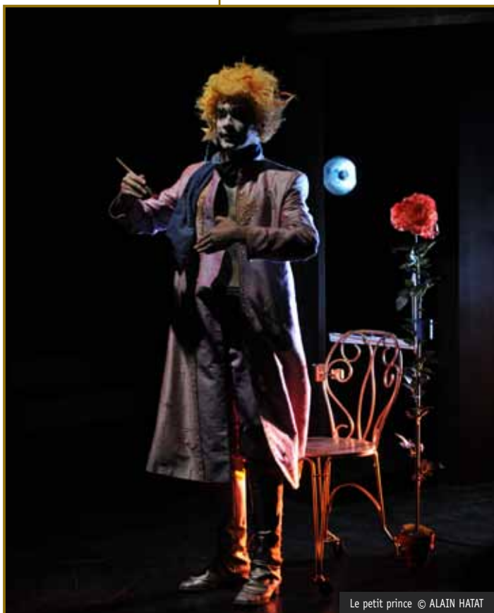
Le petit prince © ALAIN HATAT

Voir à nouveau, à travers des photos, des instantanés du spectacle. Relire ces images.